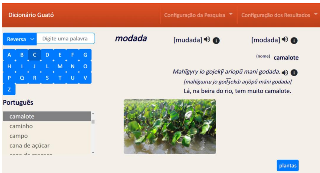
Figura 2: A entrada “ modada ” no dicionário multimídia guató – português

O dicionário está disponível online 10 (veja a Figura 2) e na forma de aplicativo. Estes produtos, assim como a versão do dicionário em PDF, já foram repassados para as lideranças das duas TIs do povo guató. O dicionário online integra a plataforma Japiim, em desenvolvimento, projetada por Helder Perri. Esta plataforma permitirá a edição do dicionário online, sendo possível, no futuro, os Guató inserirem ou corrigirem dados.