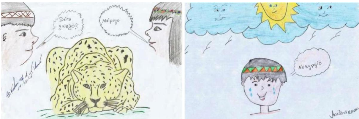
Figura 4: Desenhos de crianças guató utilizados na confecção da 1ª cartilha

Na primeira oficina de revitalização na TI Baía dos Guató, o conteúdo lecionado incluiu, sobretudo, itens lexicais de diferentes campos semânticos: animais, plantas, cultura material, parentesco, partes do corpo e números. O conteúdo apresentado durante a oficina virou uma cartilha, que foi devolvida à comunidade em formato PDF por meio de celulares. Além de listas de palavras, essa cartilha apresenta algumas frases, como Déra gwajo? ‘O que você está vendo?’ e Nakypyo ‘Estou com calor’, como mostra a Figura 4 abaixo. Também pode-se observar que, nessa cartilha, foram incluídos desenhos de crianças que participaram da oficina.