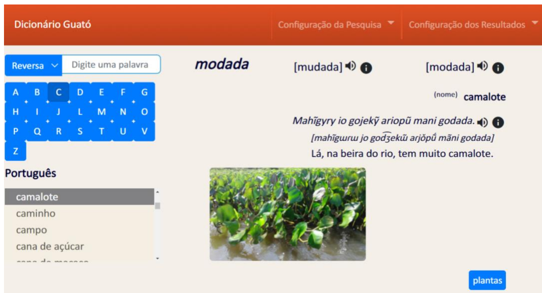
Figura 2: A entrada “ modada ” no dicionário multimídia guató – português

O dicionário está disponível online 10 (veja a Figura 2) e na forma de aplicativo. Estes produtos, assim como a versão do dicionário em PDF, já foram repassados para as lideranças das duas TIs do povo guató. O dicionário online integra a plataforma Japiim, em desenvolvimento, projetada por Helder Perri. Esta plataforma permitirá a edição do dicionário online, sendo possível, no futuro, os Guató inserirem ou corrigirem dados.