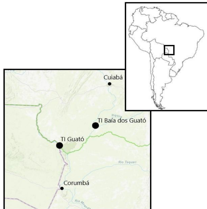
Mapa 1: Localização das TI Guató e TI Baía dos Guató.

Após anos de reivindicação territorial, os Guató retomaram parte de seu território ancestral e, atualmente, habitam duas terras indígenas (TIs), na porção setentrional do Pantanal (veja o Mapa 1 abaixo). No Rio Paraguai está situada a TI Guató, que faz parte do município de Corumbá (MS), na divisa com Mato Grosso e com a Bolívia. No alto curso do Rio São Lourenço, no município de Barão de Melgaço (MT), localiza-se a TI Baía dos Guató. Esta TI foi homologada em 2018, no governo Temer. Porém, em dezembro do mesmo ano, o ato foi suspenso através da tese do Marco Temporal, segundo a qual o direito à posse de uma TI só seria garantido aos povos que ocupassem o território no momento da proclamação da Constituição atual, em 1988.