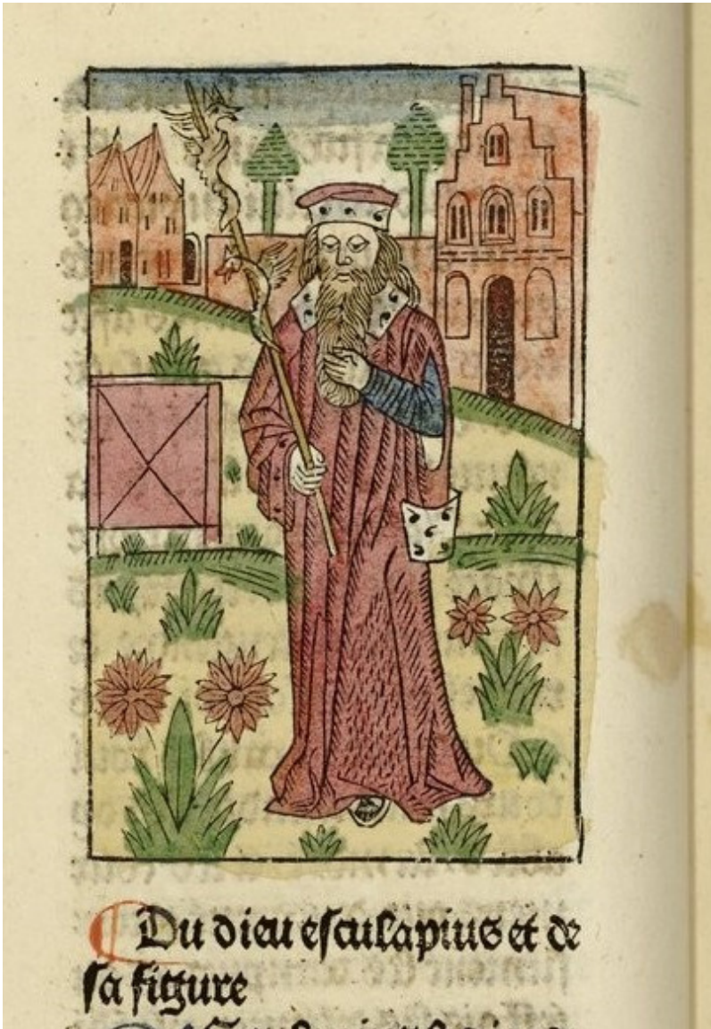
Fig. 1: Imatge retallada de la compilació ovidiana, Bruges: Colart Mansion 1484, fol. 35v.